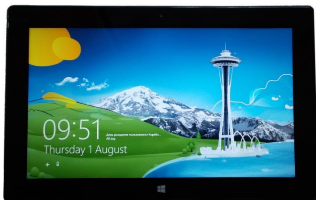
Рис. 5. Старт

Изначально на планшете была установлена английская версия Windows 8. Локализация заняла минимум времени и не вызвала никаких сложностей или проблем с работой предустановленных приложений. Достаточно было при начальной настройке выбрать свое местоположение.