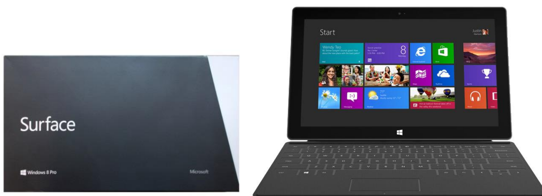
Рис. 1. Упаковка и общий вид*

Свои впечатления о Surface начну с небольшой предыстории. Я никогда не был любителем планшетных компьютеров и воспринимал их, как что-то несерьезное, возможно, полезное для общения, конечно, для игр, но не для профессионального использования. Однако, планшет появился у меня именно благодаря профессиональной деятельности, как участника партнерской программы Microsoft и ассоциации компаний партнеров IAMCP. Давним участникам партнерской ассоциации были предоставлены маркетинговые образцы планшетников Surface. Сразу же хочу уточнить, что речь пойдет именно о версии Pro с полноценной Windows 8 Pro (теперь уже 8.1).