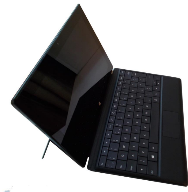
Рис. 3.* Общий вид.

Для преподавателей, продавцов, сотрудников, часто ведущих переговоры можно подключить проектор или, например, широкоформатную панель.