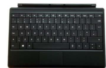
Рис. 4. Внешняя клавиатура

С внешней клавиатурой планшет полностью идентичен ультрабуку и по размерам, и по функциональности. Аппаратная клавиатура тонкая, подключается через специфический разъем внизу планшета. При подключении клавиатуры (так же, как и разъема питания) планка фиксируется небольшим магнитом, так и не ошибешься, и разъем надежно крепится. Очень удобно! Приятное дополнение: входящий в комплект стилус, по форме и размеру – в точности обычная ручка, тоже очень удобен для использования в презентациях, при работе с графикой, а иногда и с текстом.